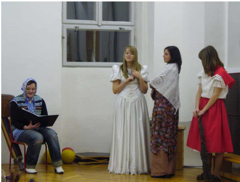
Divadlo pro předškoláky