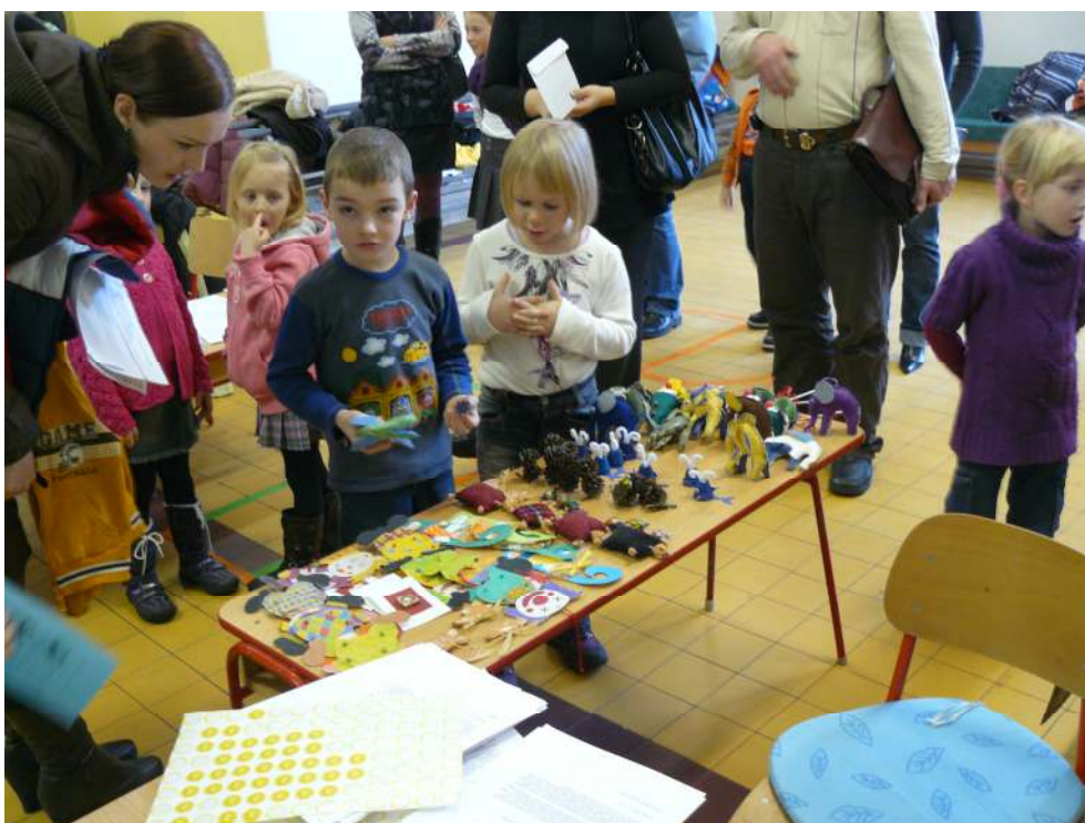
Zápis dětí do 1. tříd