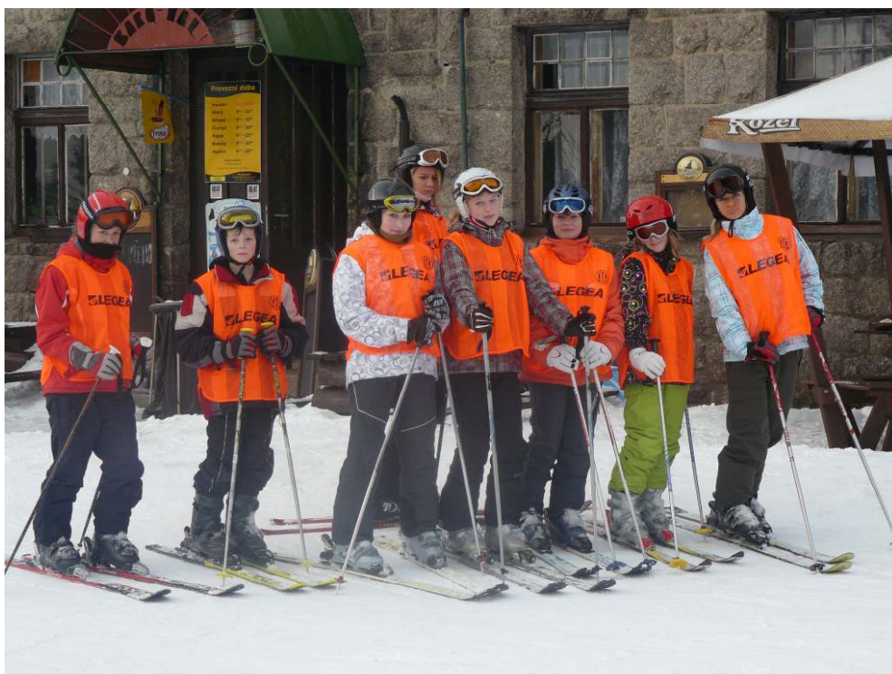
Lyžařský výcvikový kurz 7. Tříd