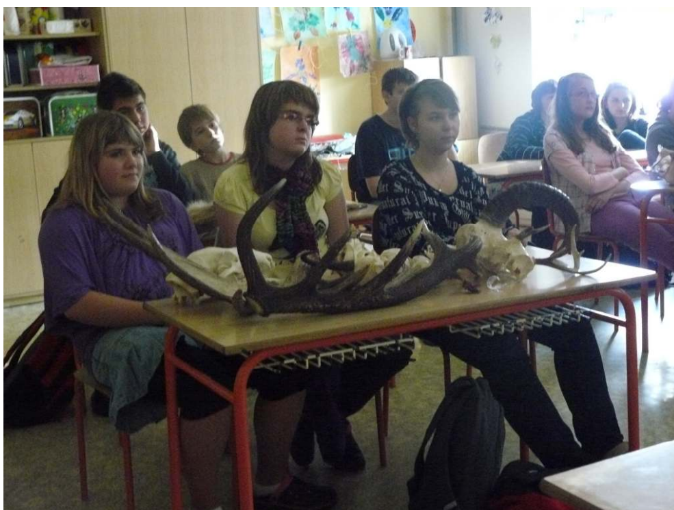
Přednáška o myslivosti