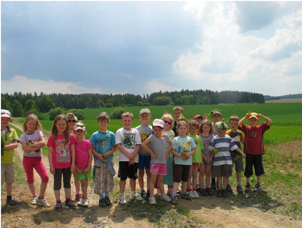
ŠVP 1. třídy