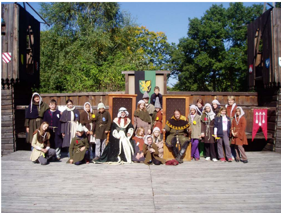
Adaptační kurz 6. Ročníků