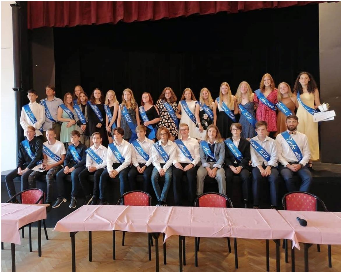
Rozloučení s devátáky