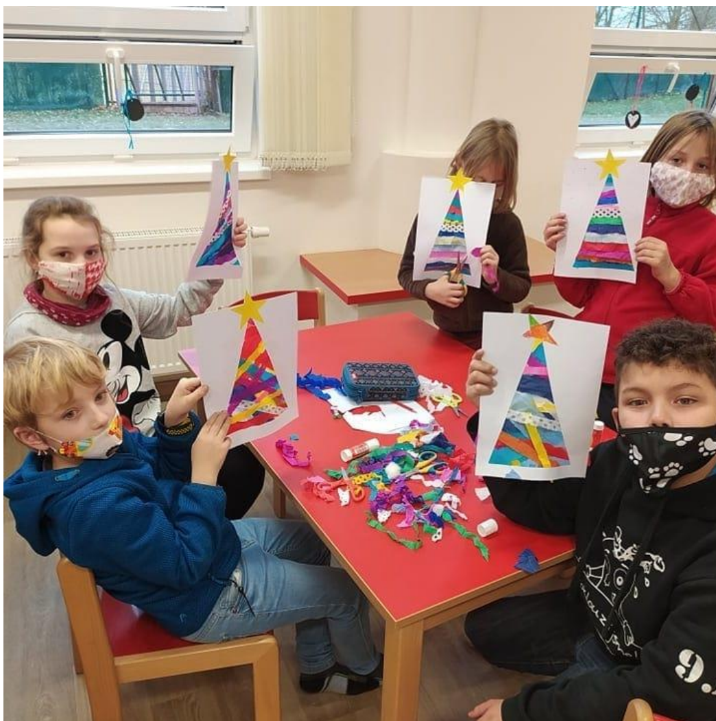
Vánoční tvoření ve ŠD

pokud tomu nebudou bránit provozní důvody.