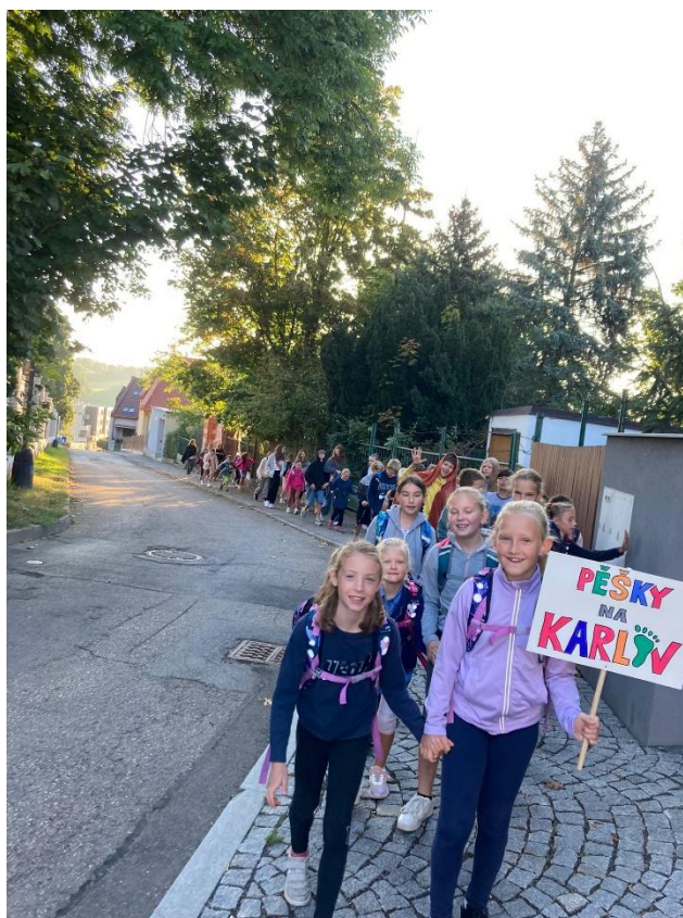
Pěšky do školy

Policie ČR Benešov, Čechova 1996 Benešov