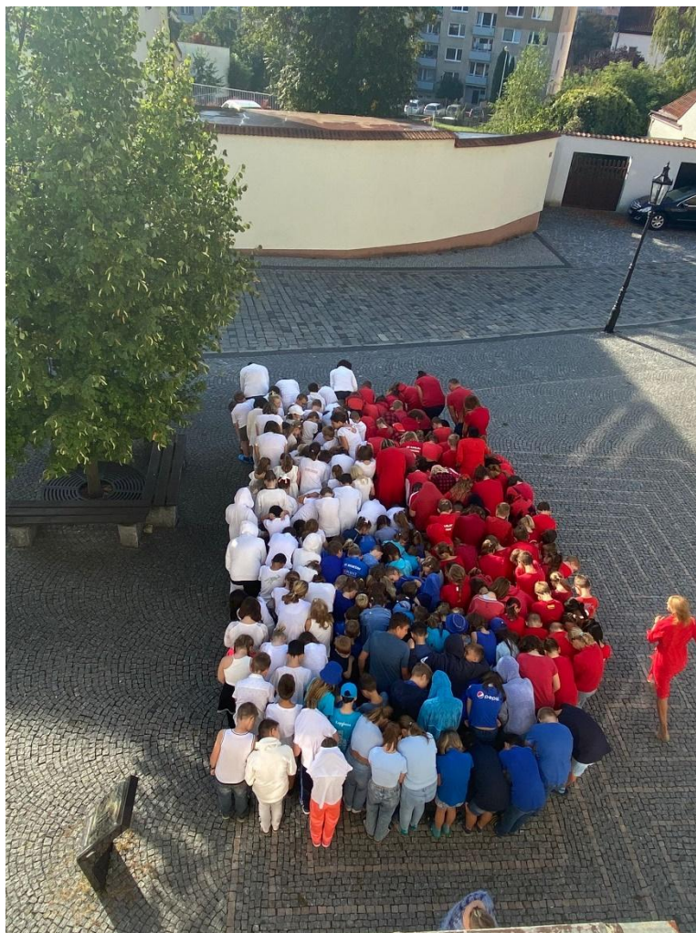
Státní svátek České státnosti